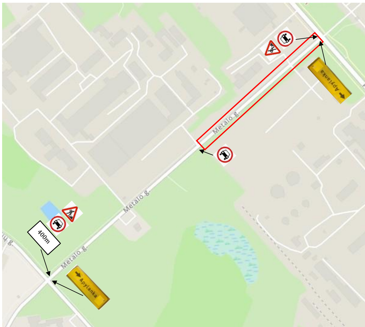
Schema Nr. 2